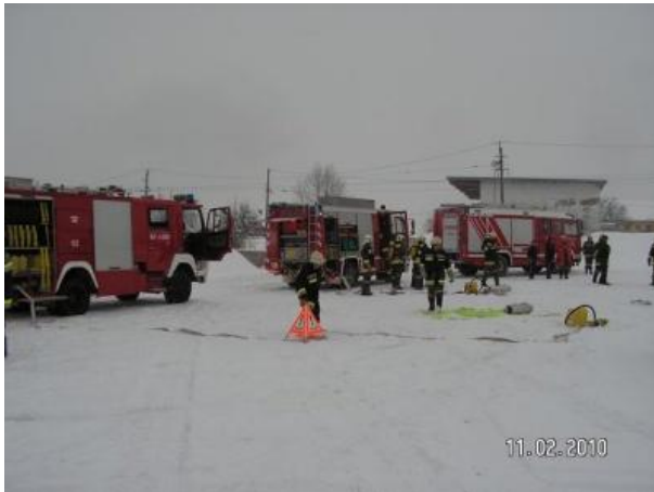
11.02.2010: Brand Gummiflüssenhaufen Transporte Reisinger Weibern