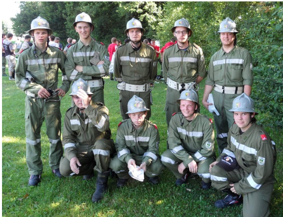
Unsere Bewerbungsgruppe beim Landesbewerb in Attnang

Vor ungefähr 4 Jahren wurde in Gaspoltshofen wieder eine Bewerbungsgruppe gegründet. Dies war ein sehr schwieriger Beginn, da es vorher einige Jahre keine gegeben hatte. Wir mussten uns viel Wissen und Techniken selbst aneignen um einigermaßen mit der Konkurrenz mithalten zu können. Doch es gelang uns eine tolle Gruppe zusammenzustellen und wieder aktiv am Bewerbswesen teilzunehmen. Wir streben dabei nicht nach Topleistungen, sondern sehen die Leistungsbewerbe als wichtigen Teil der Ausbildung.