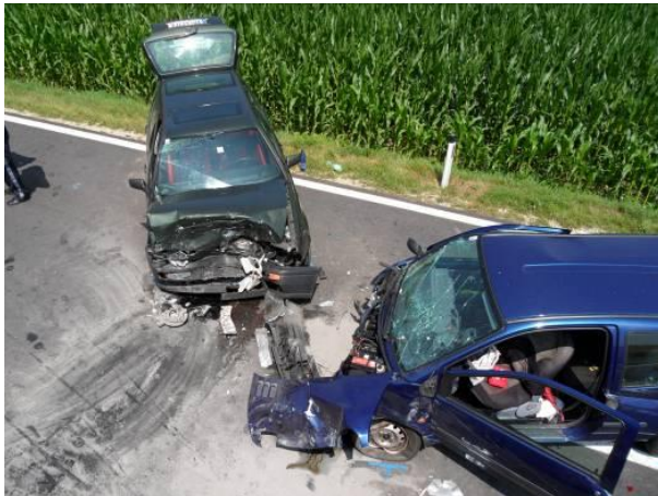
16.07.2010 Verkehrsunfall B135 Richtung Schwanenstadt